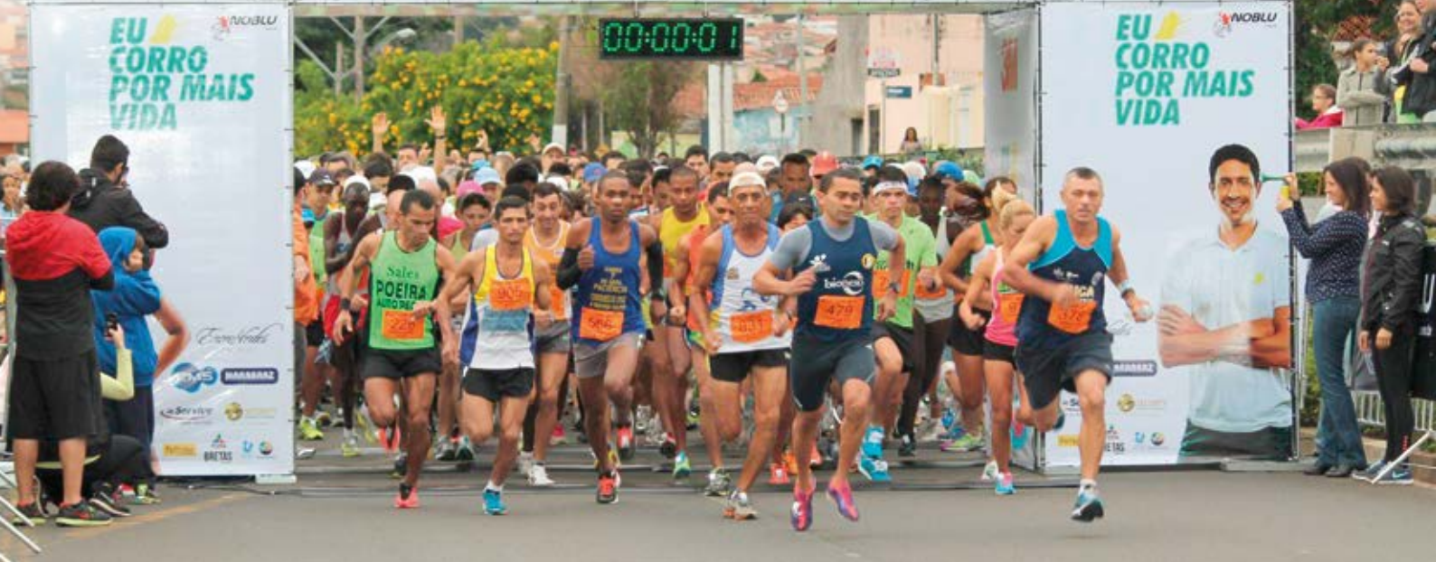
Evento realizado em 2014.