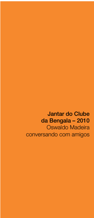
Jantar do Clube da Bengala – 2010 Oswaldo Madeira conversando com amigos