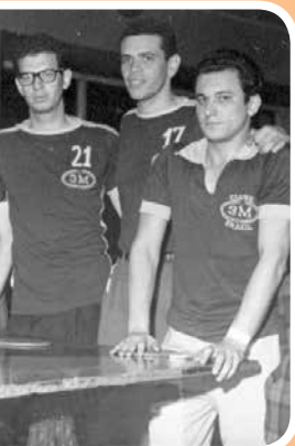
no Torneio de