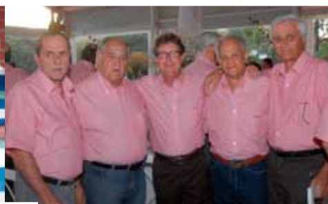
Festa da Bengala 2011