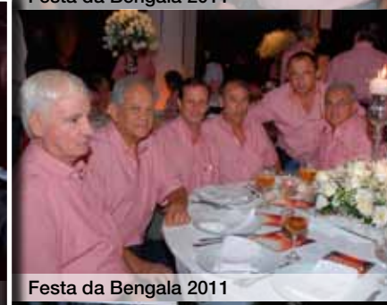
Festa da Bengala 2011