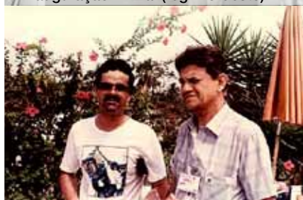
Convenção de vendas (Salvador - BA)