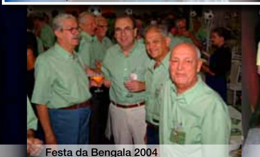
Festa da Bengala 2004