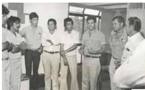
Inauguração – Filial (reg. Nordeste)