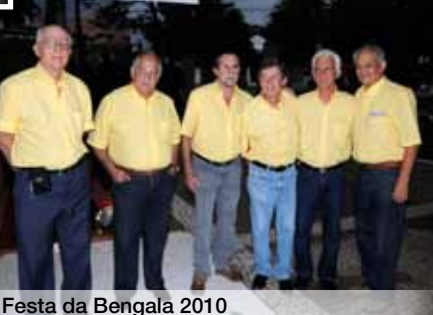
Festa da Bengala 2010