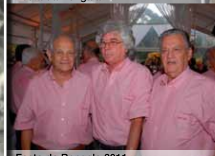
Festa da Bengala 2011