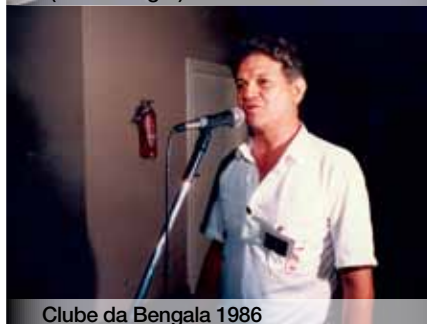
Clube da Bengala 1986