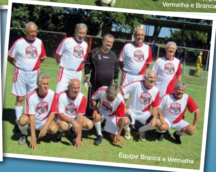
Equipe Branca e Vermelha