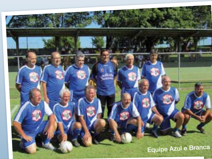
Equipe Azul e Branca