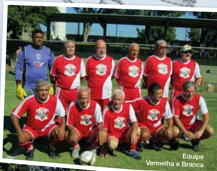
Equipe Vermelha e Branca