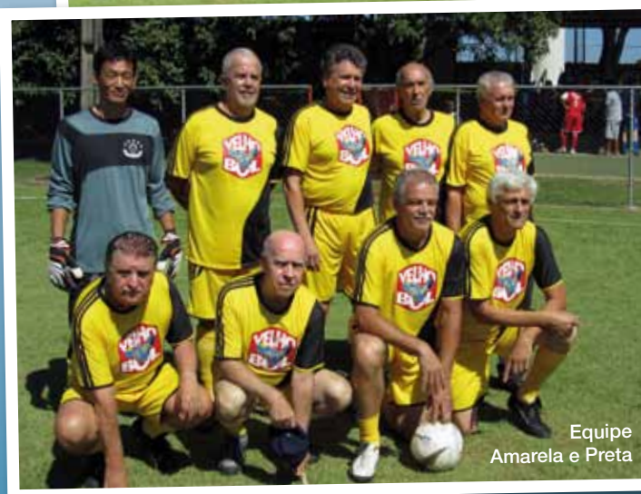
Equipe Amarela e Preta